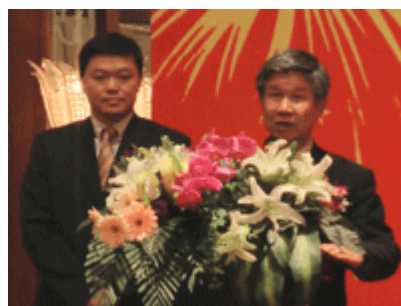
SEC 董事长徐先生和本公司社长兼子先生