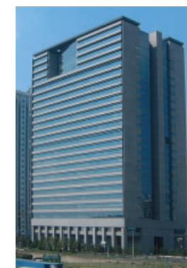
トレードピアお台場